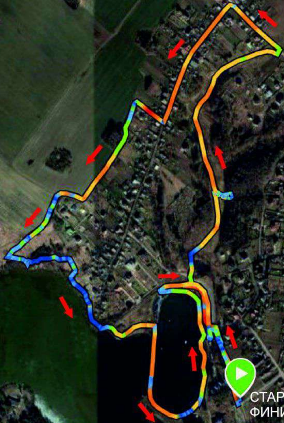
СХЕМА ТРАССЫ 5 КМ